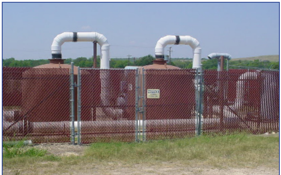
A bioventing system in use on the former Kelly AFB.