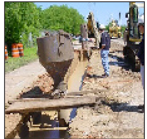
Contratistas de la fuerza aérea instalan una barrera reactiva permeable fuera de la antigua base aérea Kelly en San Antonio, Texas.